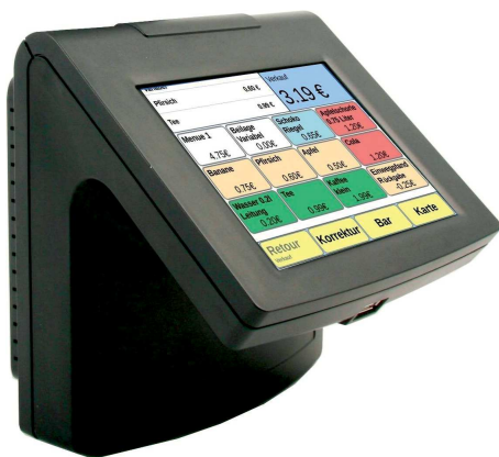
Bezahlvorgang elektronische Börse